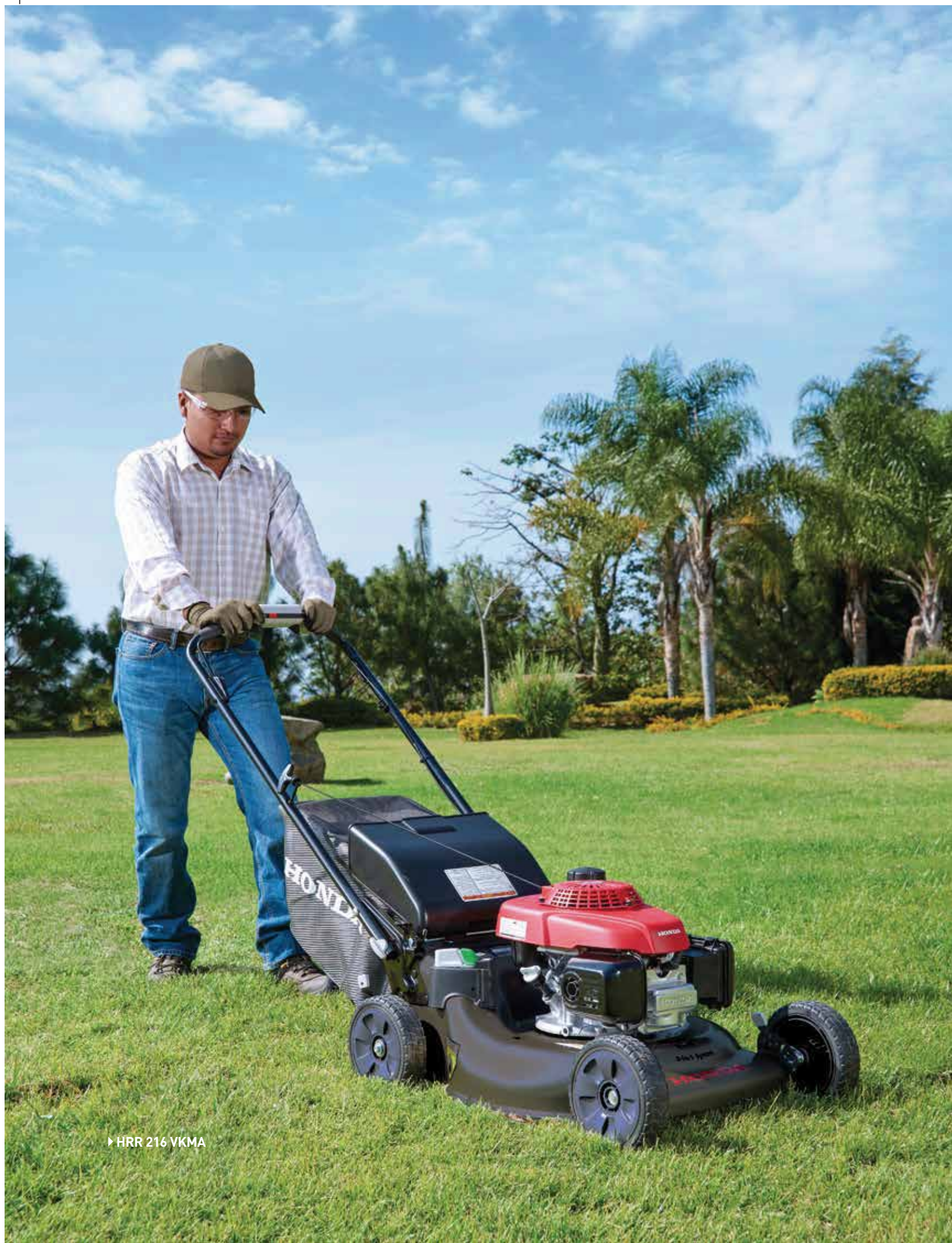
▶ HRR 216 VKMA