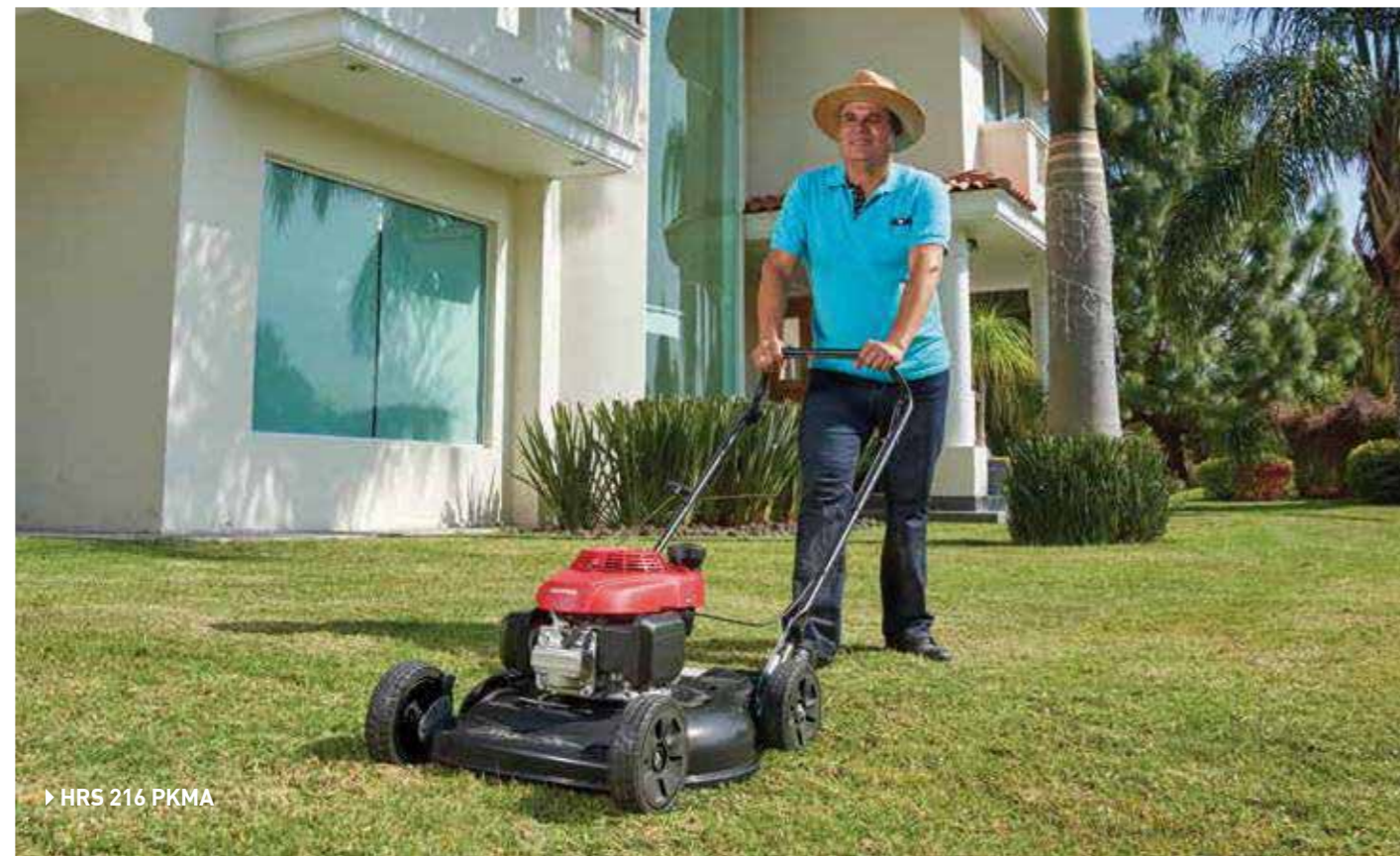
▶ HRS 216 PKMA