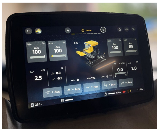
myCockpit: personalice el concepto de operación