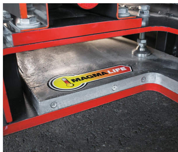
Calentamiento casi un 60 % más rápido con el exclusivo sistema de calefacción MAGMALIFE.