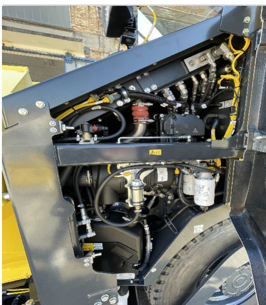
Ahorro de hasta un 17 % de combustible — sistema hidráulico regulado por demanda — con BOMAG ECOMODE.