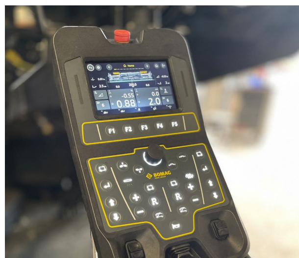
Panel lateral de la regla con pantalla totalmente gráfica; acceso directo a todas las funciones principales